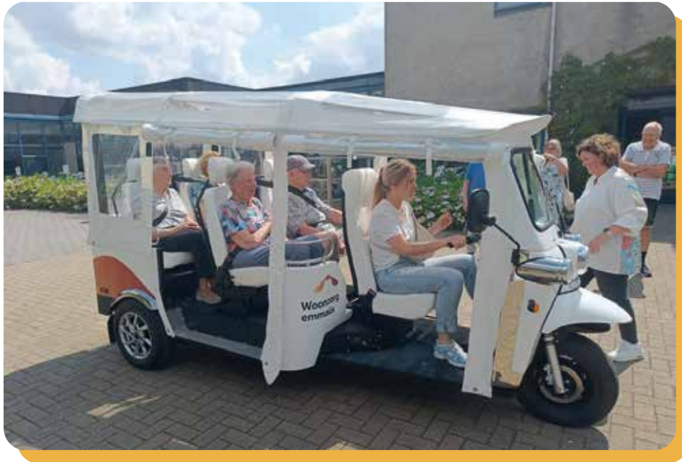
Vanop de terrassen in Heist-op-den-Berg zwaaien ze de passagiers van de e-Tuk vrolijk toe